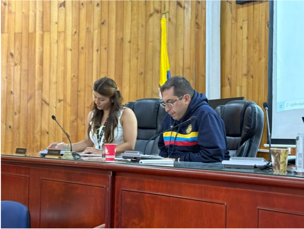
Informe Pacto de Corresponsabilidad – Consejo Local de Mujeres Alcaldía Local de Puente Aranda