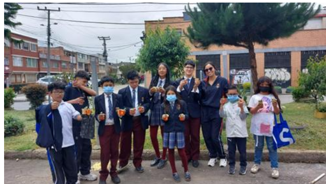
Registro fotográfico de la jornada