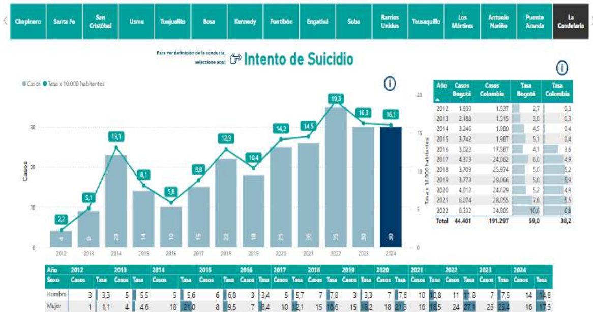
Imagen 1. Casos consumados de suicidio en la Localidad de La Candelaria.

En la Localidad de La Candelaria, aunque su densidad poblacional es baja en comparación con otras localidades, los indicadores relativos son igualmente preocupantes. De acuerdo con las cifras reportadas por SALUDATA para el año 2024, se registraron 30 casos de suicidio desagregados en 16 casos por mujeres y 14 casos por hombres, lo que representa una tasa representativa por cada 10.000 habitantes en la ciudad.