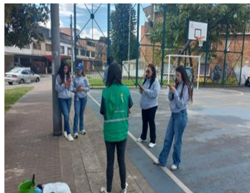
Registro fotográfico de la jornada