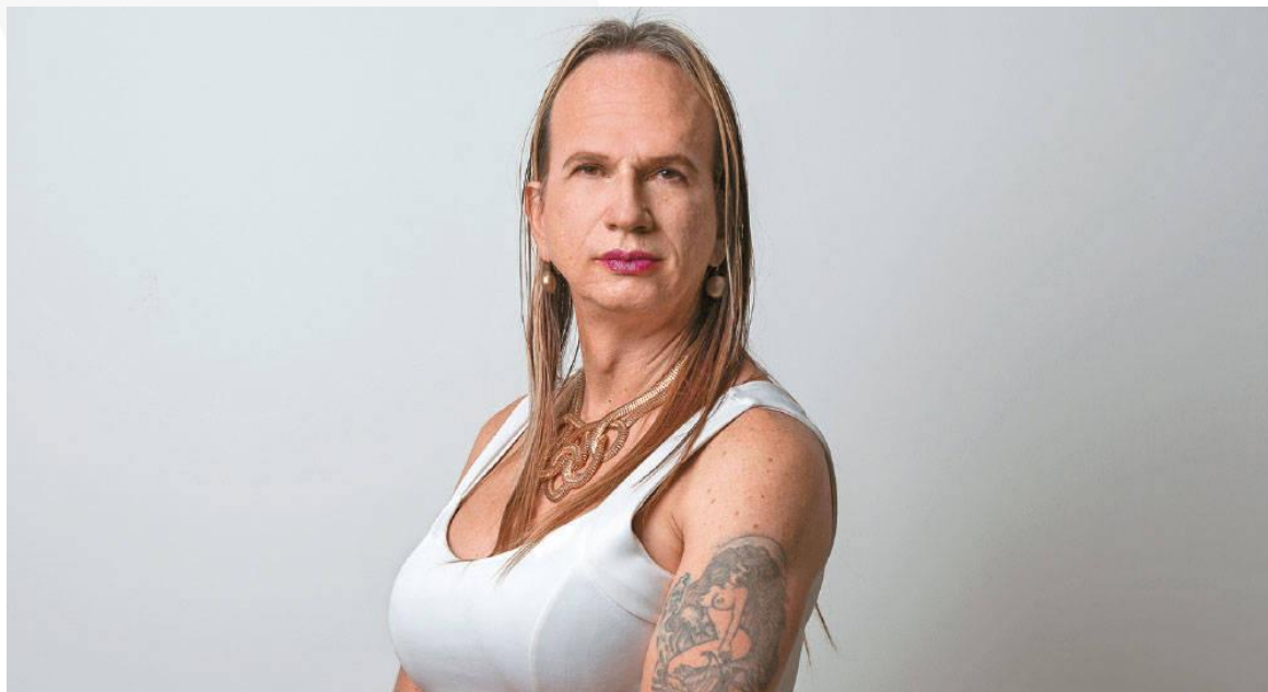
Brigitte Baptiste, imagen tomada de: https://www.semana.com/enfoque/articulo/reflexion-de-brigitte-baptiste-sobre-la-pandemia-y-otras-notas-de-la-semana/671769/