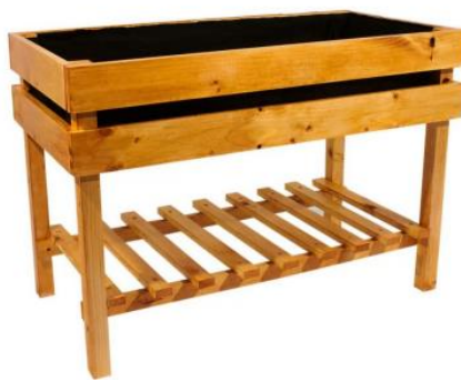
Vista de aula itinerante

Para su entrega, debido a que son 6 aulas itinerantes, se le realizará la entrega a una JAC u organización por UPZ, para la selección de la JAC u organización se deberá tener en cuenta los espacios y condiciones técnicas de cada JAC u organización que se postule. Se debe soportar la entrega mediante acta y se le entregara a la JAC u organización un manual de uso y mantenimiento.