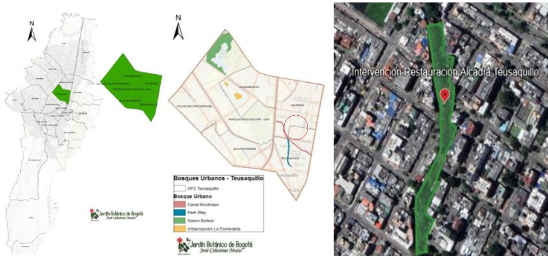
Imagen 1: Localización Parque Urbanización La Esmeralda