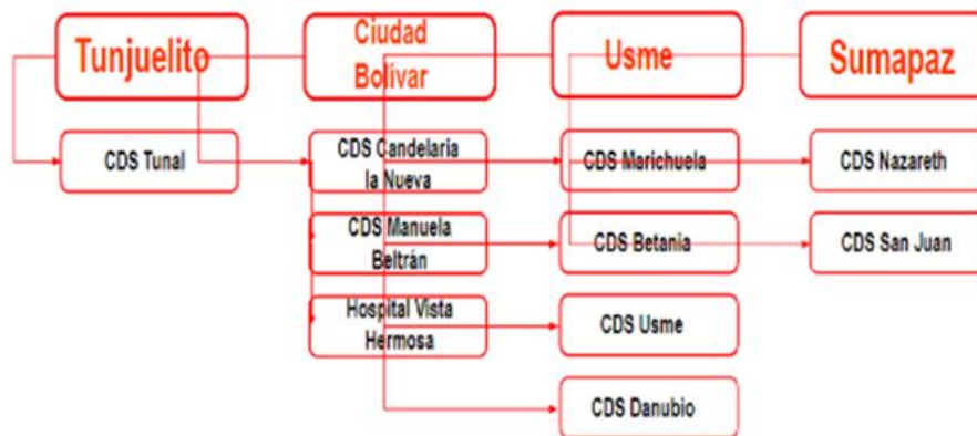
Ilustración 4 Ubicación Puntos Rojos