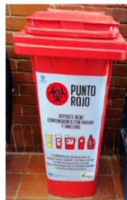
Punto rojo CDS Marorivá

Son contenedores ubicados en los centros de salud de la Subred Sur para la disposición de residuos cortopunzantes (agujas, lancetas y agujas con cuerpos de jeringas que no se puedan separar) que se encuentren en manos de los usuarios.