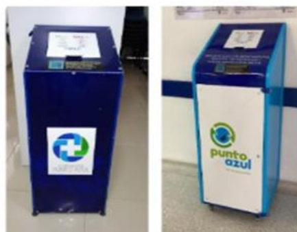
Ilustración 1 Puntos azules

Contenedores ubicados para la disposición de medicamentos vencidos, parcialmente consumidos o deteriorados que se encuentren en manos del consumidor final.