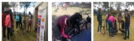
Construcción de Conocimiento