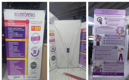
Pendón Violentómetro (Factor Ponderable)