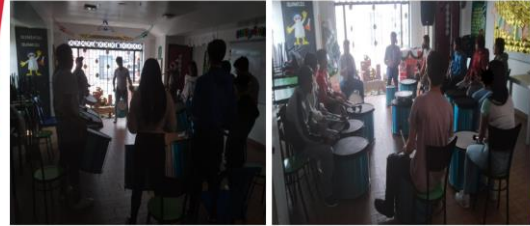
Taller de Batucada, ICBF Venecia