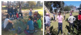
Encuentro de participantes