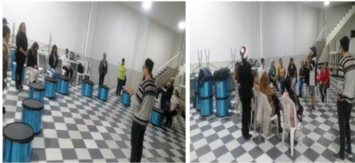
Taller de Batucada, Barrio el Carmen