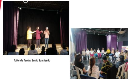
Taller de Teatro, Barrio San Benito