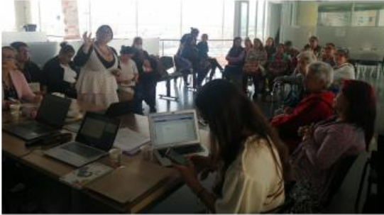
Abnrl COLMYG Extraordinario