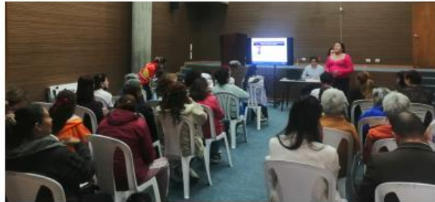
Marzo presentación de proyectos 1925, 1915, 1916 en instancias de mujeres