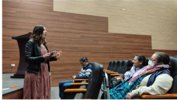
Mayo Seguimiento a Convenio Universidad nacional y proyectos PLT 2022

En relación con este este compromiso es pertinente reconocer la experiencia que tuvimos en los proyectos ejecutados vigencia 2021, donde solo se contó con dos delegaciones, una que fue designada oportunamente por la instancia y otra que se designó finalizando el contrato con el operador; por tal razón la alcaldía en articulación con SDMujer presento informes ante el COLMYG con el fin de que las lideresas parte de la instancia pudiesen establecer diálogos junto con las supervisiones y el operador