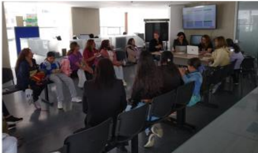
Febrero: Mesa ampliada presentación de formuladoras y supervisoras para proyectos del sector mujer

Compromiso 4. Para la ejecución de los proyectos en las vigencias 2022 y 2023 las y los alcaldes locales se comprometen a vincular con voz y voto e incidencia real en Mesas de seguimiento a la implementación de proyectos del sector mujer a: 1 delegada de los COLMYG y/o la delegada territorial de CCM; y a una representante del sector mujeres. Quienes estén contratadas por alguna de las partes no podrán ser parte de la mesa de seguimiento.