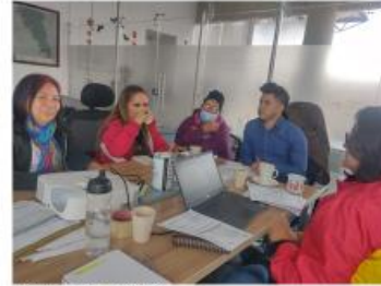
Reunión octubre 2022