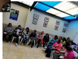
Reunión Mayo 2023

En relación con el Plan Local de Transversalización 2023, este fue socializado en el COLMEYG en mes de mayo durante la firma de la actualización normativa, este plan compromete las siguientes metas: a) Vincular 450 mujeres cuidadoras a estrategias de cuidado. b) Capacitar 400 personas para la construcción de ciudadanía y desarrollo de capacidades para el ejercicio de derechos de las mujeres, c) Vincular 600 personas en acciones para la prevención del feminicidio y la violencia contra la mujer, d) Formar personas en prevención de violencia intrafamiliar y/o violencia sexual, e) Vincular personas a las acciones y estrategias para la prevención del embarazo adolescente f) Incluir personas en actividades de educación para la resiliencia y la prevención de hechos delictivos.