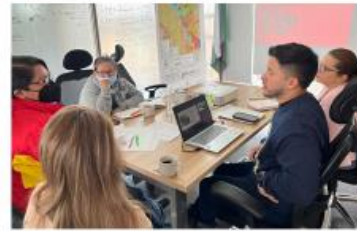
Reunión febrero 2023

Como ustedes recuerdan nuestra última reunión para el seguimiento fue en febrero, la misma cuyo soporte se encuentra en la plataforma COLIBRÍ según lo establecido en el pacto.