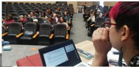
Reunión Abril 2023