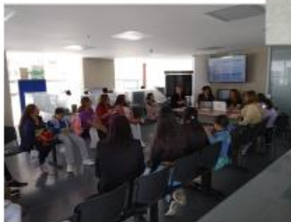
Reunión febrero 2023

Compromiso 2 Para todas las fases de la formulación de proyectos de inversión local del Sector Mujeres y que sean susceptibles de ser transversalizados con enfoque de género en la vigencia II/2022 - 2023, se incluirán explícitamente los enfoques de la PPMYEG (diferencia, de género, de derechos, ambiental y territorial) y las metas referidas al enfoque diferencial, nombrando la diversidad de las mujeres en sus diferencias y diversidades. Como mínimo, se invitará a participar a la persona promotora de la iniciativa, a una delegada por el COLMYG y/o quien haga sus veces, la CCM Territorial y la representación de la SDMujer. Se promoverá el consenso para la incorporación efectiva de las voces ciudadanas. Mesas ampliadas.