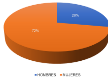
REPORTE DECRETO 332 DE 2020