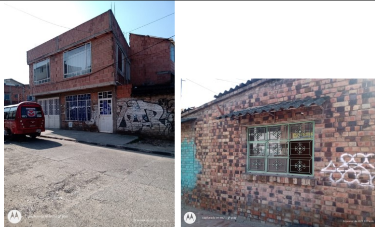
Fotos del recorrido sector de anda lucia- 24 de marzo de 2023