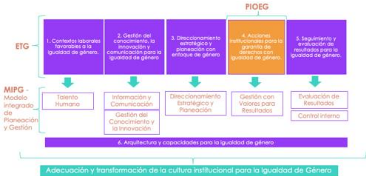
Figura 2. Estructura del Sello En Igualdad