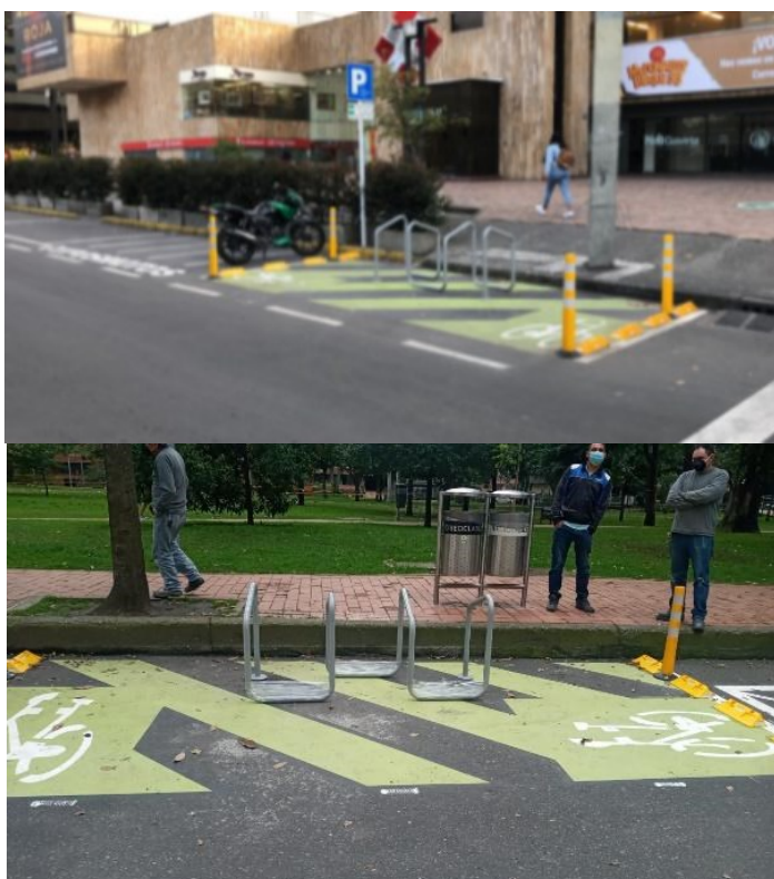
Figura 2. Mobiliario tipo rack en vía