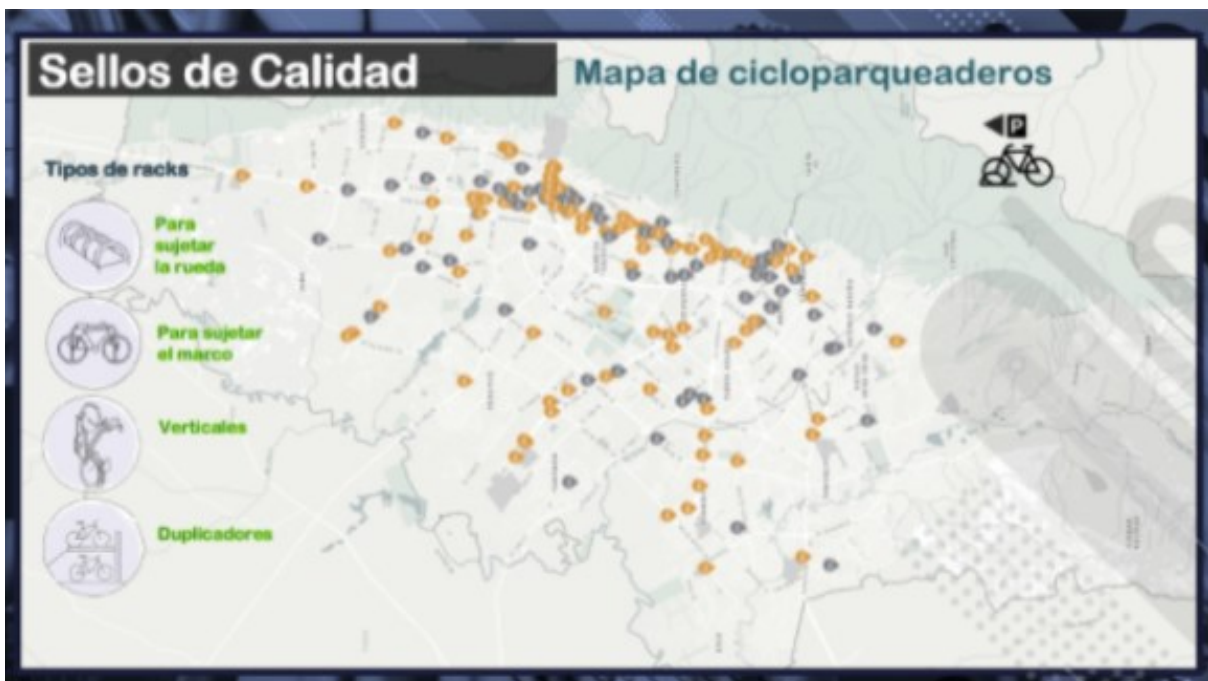
Figura 3. Mapa de cicloparqueaderos con Sellos de Calidad