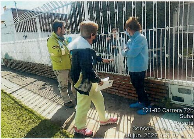
Descripción: Socialización de traslado de árboles sembrados por la comunidad en la KR 71 D en el andén del costado occidental.