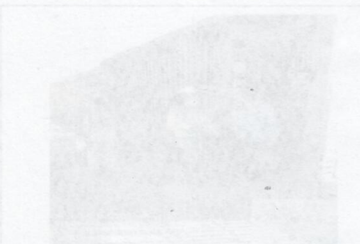
Descripción: Socialización de traslado de árboles sembrados por la comunidad en la KR 71 D en el andén del costado occidental.