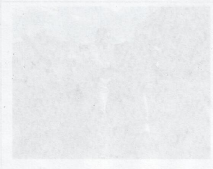
Descripción: Recorrido a posible lugar para traslado de especies arbóreas sembrados por la comunidad en la KR 71 D en el andén del costado occidental.