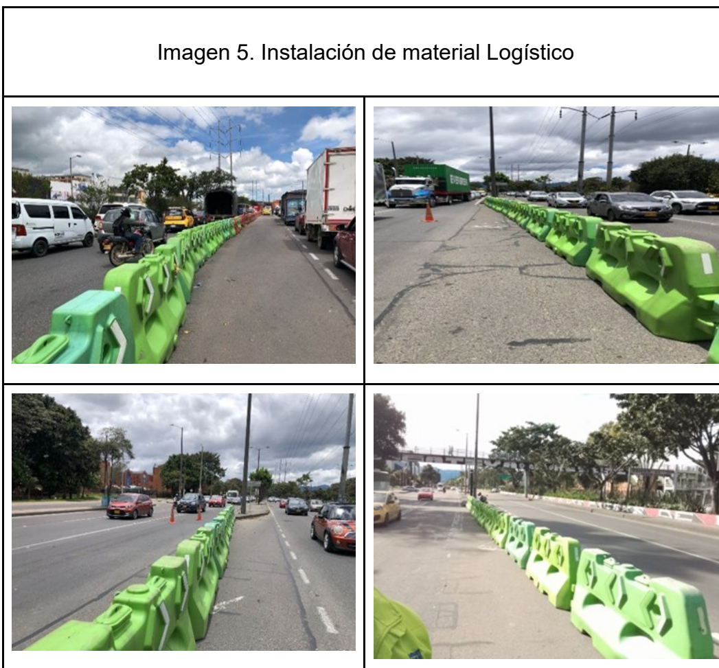
Imagen 5. Instalación de material Logístico

Ilustración: Material Logístico Av. Calle 80, KR 102, KR 112F, KR 116B – KR 119