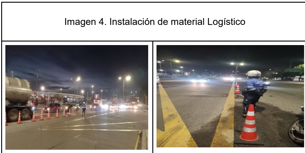
Imagen 4. Instalación de material Logístico

Ilustración: Material Logístico Av. Calle 80, portal 80