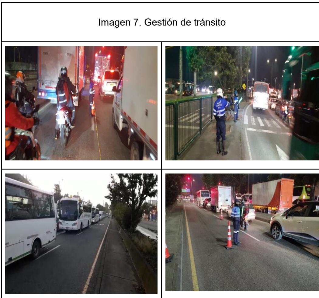
Imagen 7. Gestión de tránsito

Ilustración: Actividades de Gestión de Grupo Guía