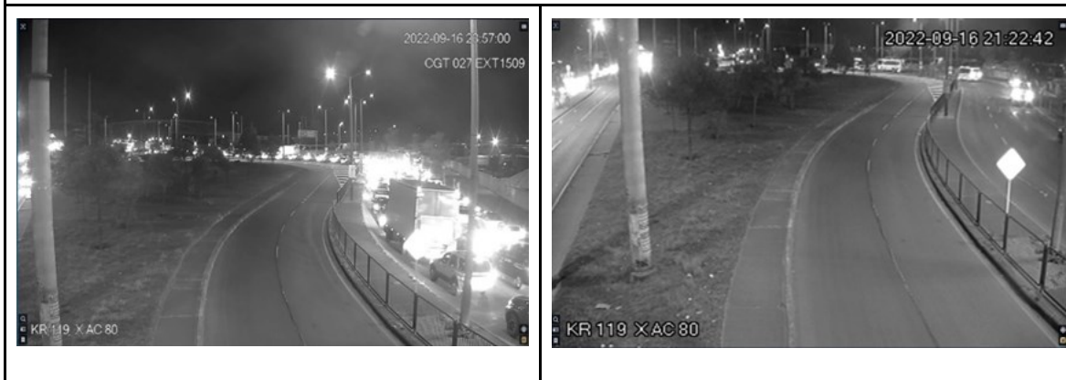
Ilustración: Actividades de Control y Monitoreo