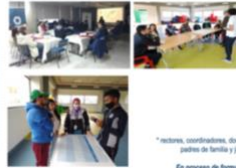
*padres, coordinadores, docentes, padres de familia y jóvenes En proceso de formulación

Comunidad educativa* de las IED la Esperanza, Bicentenario, Alfonso Reyes Echandía, Manuel Elkin Patarroyo, Jardín Absun, líderes de la Red Lazos Activos y FGS