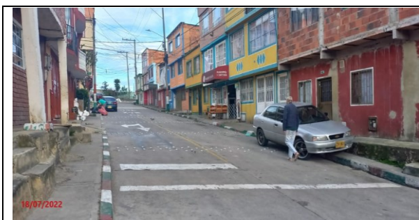
Foto No. 1. Panorámica CL 60A Sur con KR 77C, vista al occidente.