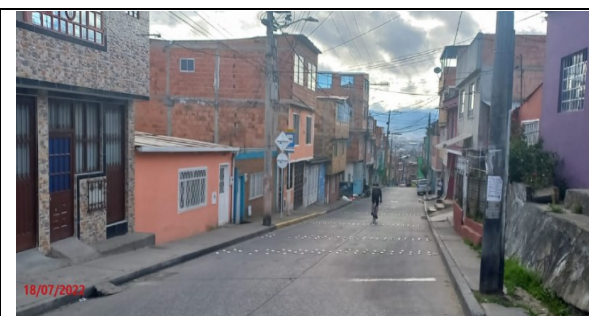
Foto No. 2. Panorámica CL 60A Sur con KR 77C, vista al oriente.

No obstante, por los antecedentes de accidentalidad el sector del requerimiento se encuentra en evaluación por parte de la Oficina de Seguridad Vial de la SDM, por lo que se remite copia de esta comunicación para que dé respuesta directa al peticionario respecto de las acciones que se están evaluando en el sector de la solicitud en cumplimiento de las funciones instauradas en el Decreto 672 de 2018.