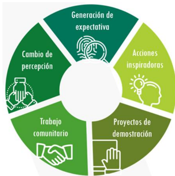
Imagen 1. Aspectos relevantes del 'urbanismo táctico'.

nuevas lógicas sociales y/o resolver inconvenientes tales como la invasión del espacio, inseguridad, mal estado o deterioro del espacio y baja afluencia de ciudadanos, siempre en compañía de la comunidad y enfocado particularmente a sitios y comunidades especialmente golpeadas por la pandemia.