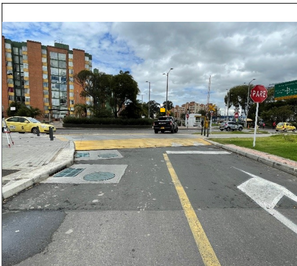
Foto 3. Carrera 66 con Avenida Calle 24 o Avenida La Esperanza. Vista al oriente. (Fotografía tomada 16 de julio del 2021).