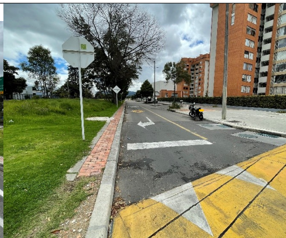
Foto 4. Carrera 66 con Avenida Calle 24 o Avenida La Esperanza. Vista al occidente. (Fotografía tomada 16 de julio del 2021).