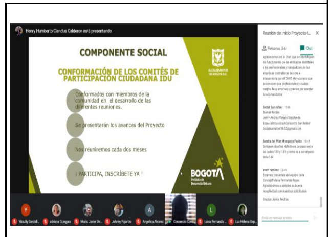
Reunión de inicio tramo 1- Explicación componente social, comité IDU