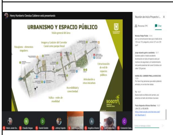
Reunión de inicio tramo 1- Explicación componente Urbanismo y espacio público