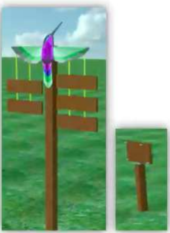
Dos tipos de señalización orientativa