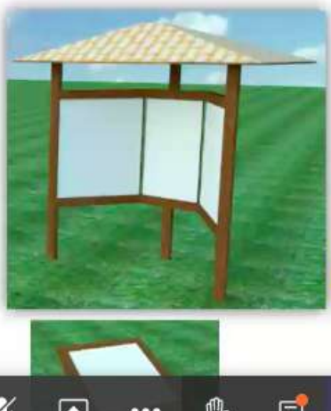
Dos tipos de señalización descriptiva