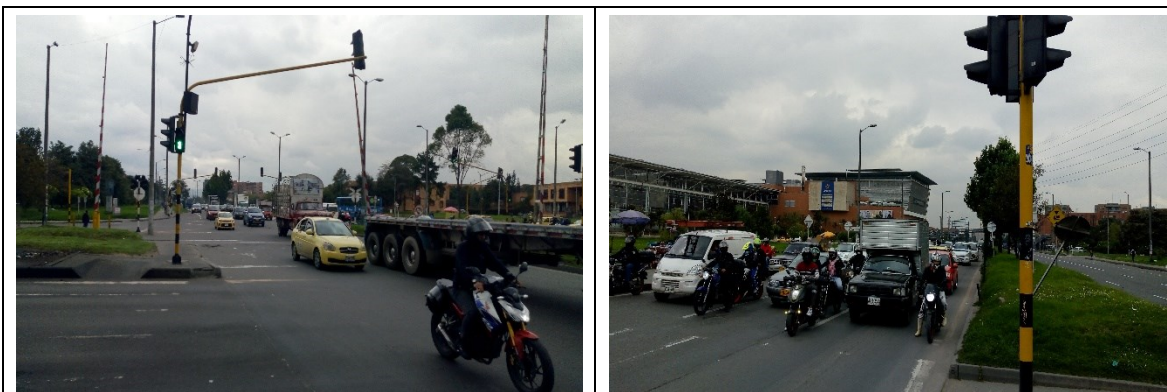
Fotos 5 y 6. Operación del flujo de la AV Ciudad de Cali.

La SDM dará continuidad a la revisión y seguimiento de las condiciones de operación de las intersecciones semaforizadas, se realizará los ajustes respectivos de acuerdo a las condiciones cambiantes del tránsito y buscando garantizar la seguridad de todos los usuarios.