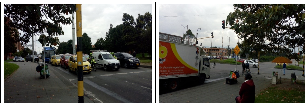
Fotos 1 y 2. Operación del flujo 4.

La anterior configuración ha permitido evidenciar mejora y optimización en la operación del control semafórico (recorridos realizados los días 28 mayo al 02 de junio de 2021).