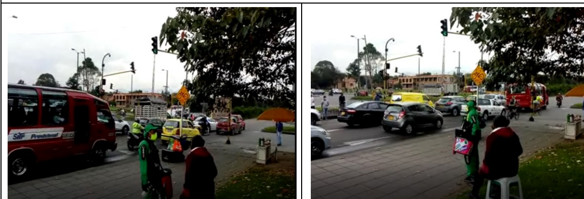
Fotos 3 y 4. Operación de los flujos 3 y 12.