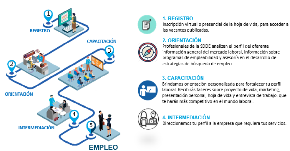
Imagen 1: Ruta de empleo

En este sentido, las personas pueden acceder a la Ruta Única de Empleabilidad Distrital que cuenta con un enfoque diferencial (jóvenes, mujeres, personas en condición de discapacidad, víctimas del conflicto, población LGBTI, afro e indígenas, adultos mayores) en sus diferentes etapas de: registro, orientación ocupacional, formación e intermediación laboral, la cual se describe a continuación.