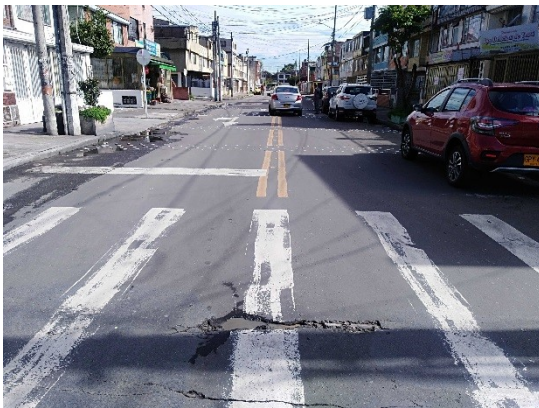
Calle 3B entre carrera 41A y carrera 41B

Con base en la visita técnica de inspección visual realizada, fue posible establecer que los tramos relacionados son de uso vehicular, que requieren actividades de Mantenimiento y/o Rehabilitación de acuerdo con lo registrado para cada uno de ellos en la Tabla anterior (Figura 3).