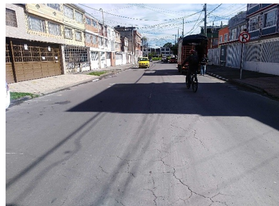
Calle 38 sur entre carrera 41B Bis