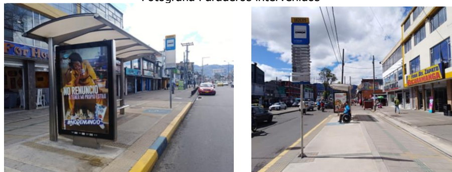
Fotografía Paraderos intervenidos

Por otra parte el Instituto de Desarrollo Urbano IDU en convenio interinstitucional con Transmilenio S.A ejecutó el contrato No. 1540 de 2017 en el cual se intervinieron durante los años 2018 y 2019 un total de 189 paraderos del Sistema Integrado de Transporte Público – SITP, con el fin de facilitar su usabilidad por parte de personas con movilidad reducida – PMR.