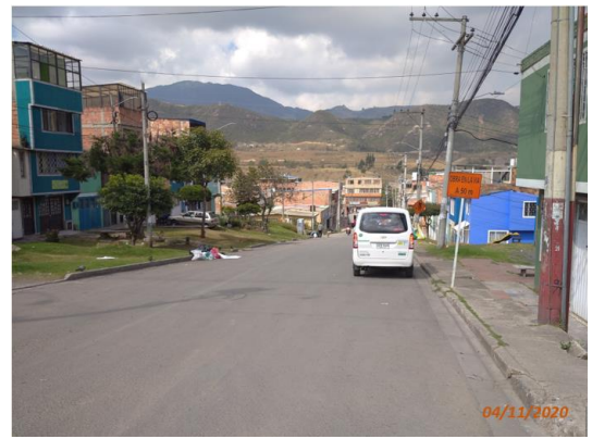
Foto 2. Calle 72 A Sur entre Carrera 14 W y Avenida Boyacá (Carrera 14 V). Vista al Occidente.