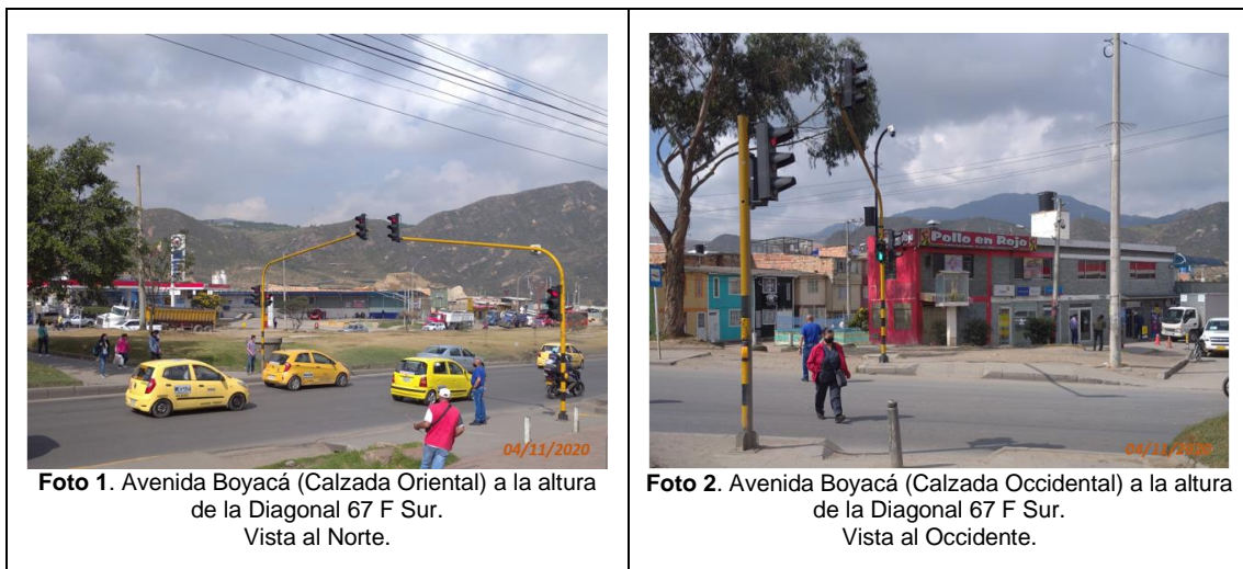
Foto 1. Avenida Boyacá (Calzada Oriental) a la altura de la Diagonal 67 F Sur. Vista al Norte.

Se presenta registro fotográfico de la visita técnica de inspección y evaluación, al sector del requerimiento, realizada por parte de la Subdirección de Señalización de esta Secretaría, el día 04 de noviembre de 2020: