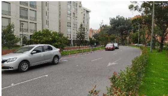
Ilustración 6 Parqueo lateral en calzada occidente de la Carrera 68A