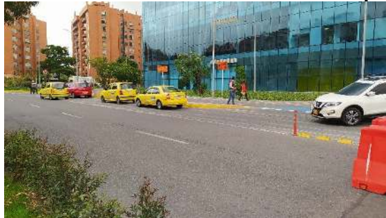
Ilustración 3 Estacionamiento de taxis en carril de incorporación a la calzada