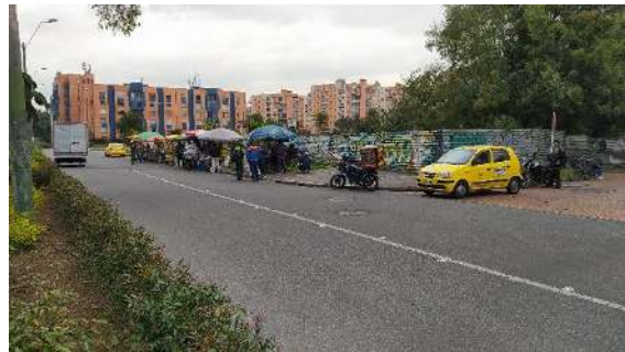
Ilustración 7 Invasión del espacio público por vendedores ambulantes en zona de andén calzada occidental de la Carrera 68A