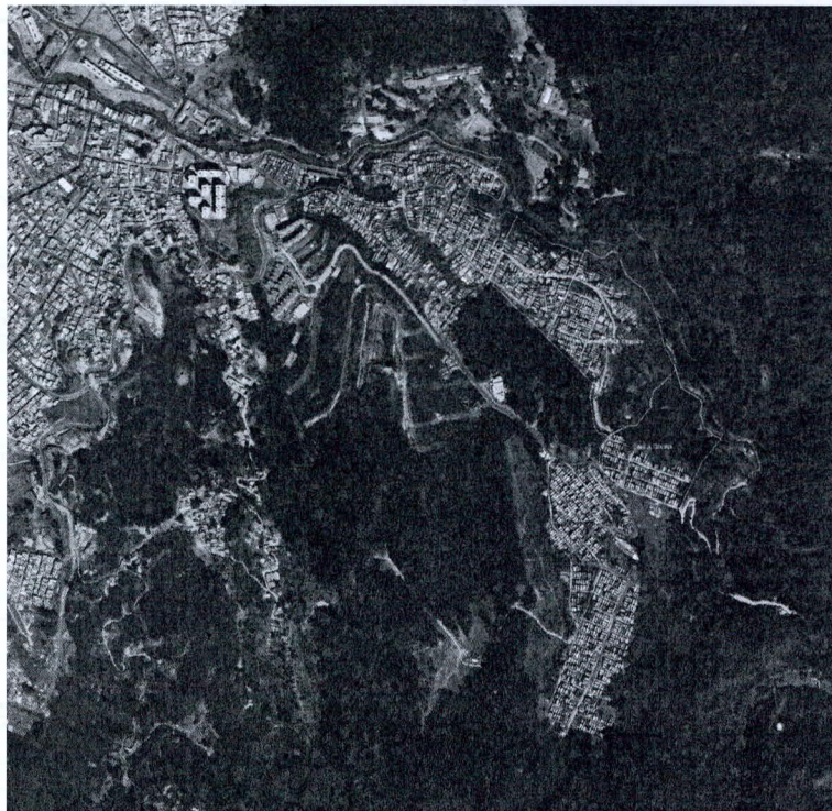
Mapa 2. Barrios y afluentes hídricos del Alto Fucha

Secretaría Distrital de Ambiente Av. Caracas N° 54-38 PBX: 3778899 www.ambientebogota.gov.co Bogotá D.C. Colombia