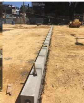
SUMINISTRO E INSTALACIÓN BORDILLO PREFABRICADO A 80