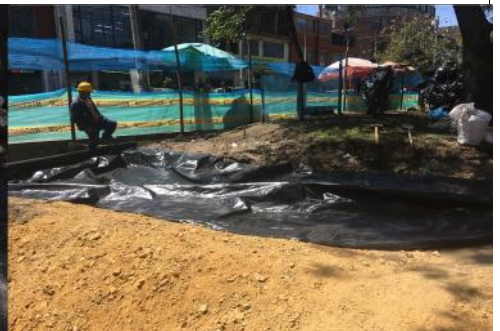
SUMINISTRO E INSTALACIÓN GEOTEXTIL