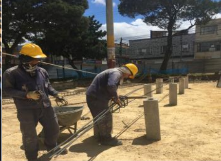
FEFUERZO ESTRUCTURAL VIGAS DE CIMENTACIÓN JARDINERAS