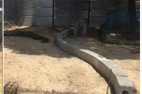
SUMINISTRO E INSTALACIÓN BORDILLO PREFABRICADO A 80 SENDERO CENTRAL