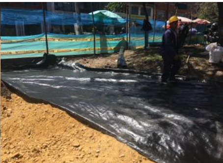
SUMINISTRO E INSTALACIÓN GEOTEXTIL