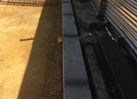
SUMINISTRO E INSTALACIÓN BORDILLO PREFABRICADO A 80