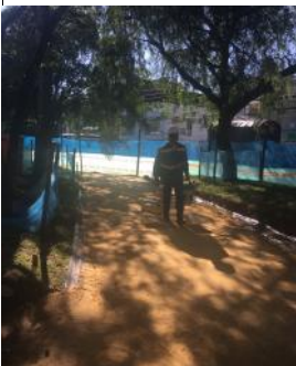
TOMA DE MUESTRAS DE DENCIDADES