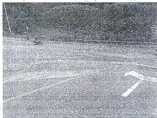
Fotografía 2. Panorámica Diagonal 38 con Transversal 1 Este, vista al Occidente.