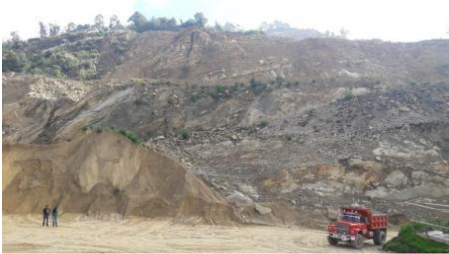
Área de ejecución de trabajos.

El área de influencia en la cual se ejecutan las obras o trabajos de restauración está localizada en la parte central de la cantera (Figura 1). Es de resaltar que, entre el borde de la zona propiamente dicha de la cantera y los vecinos más próximos, existen terrenos de los mismos propietarios, lo cual permite un aislamiento entre el sitio de trabajo y los vecinos más próximos.