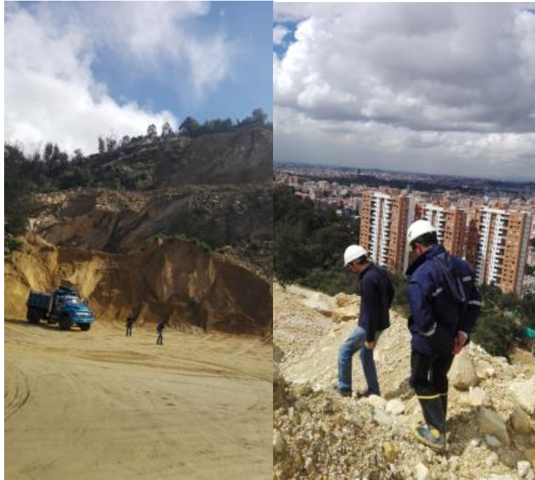
Figura 3. Población Transeúnte

Cercana al área de trabajo, se encuentra una zona adaptada para el cumplimiento de las funciones administrativas y otra utilizada por los operarios de la cantera para vestirse antes y después de realizar sus obligaciones laborales; esta zona cuenta con una oficina, cafetería, baños, zona de parqueo, cuarto de operarios, un punto de acopio y/o reciclaje de residuos sólidos y la puerta de ingreso y salida de la cantera, tanto de vehículos como de personas, los cuales son presentados a continuación.