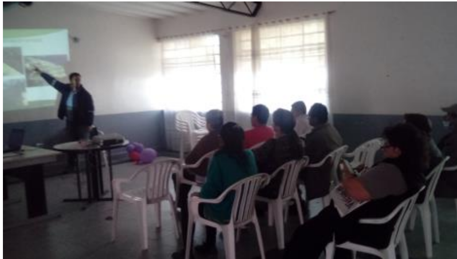
Figura 6. Convocatoria a la socialización del proyecto y las actividades del PMMRA a la comunidad.