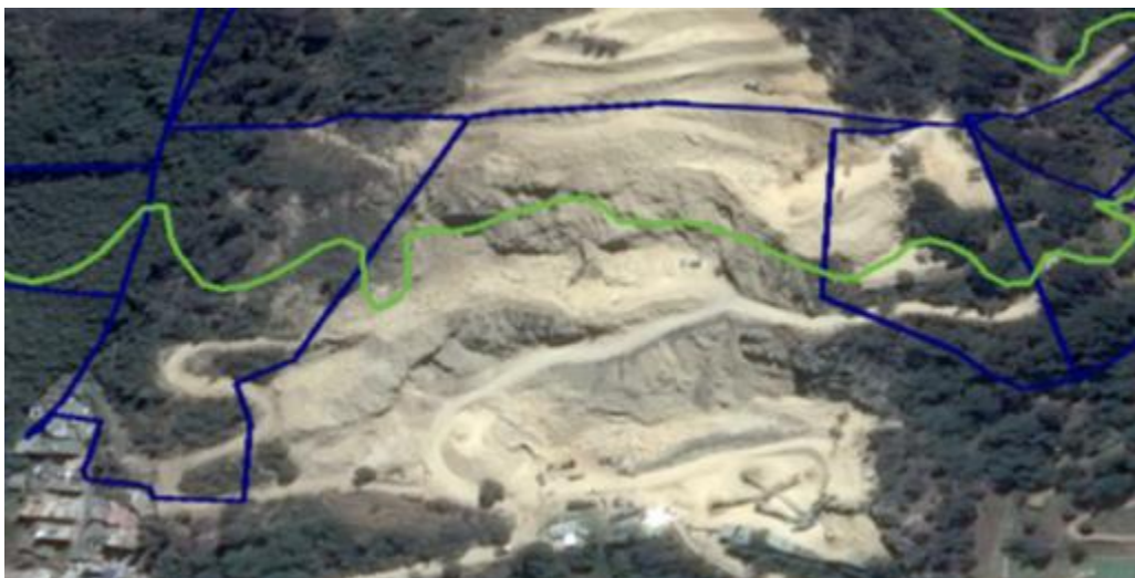
Figura 2. Localización predios con coberturas vegetales.

A pesar de que en estos predios no se evidencia a simple vista cobertura vegetal significativa, dado que corresponden a predios en donde anteriormente se realizaba la extracción de materiales, a través de la figura 2 que corresponde a una imagen satelital, y la visita de campo realizada, se pudieron observar parches de cobertura vegetal arbórea y arbustiva, que pueden ser susceptibles para una posible recuperación, restauración y/o conservación.