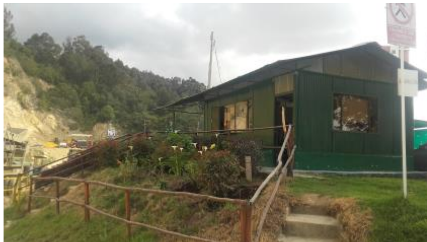
Vista Sede administrativa

Cercana al área de trabajo, se encuentra una zona adaptada para el cumplimiento de las funciones administrativas y otra utilizada por los operarios de la cantera para vestirse antes y después de realizar sus obligaciones laborales; esta zona cuenta con una oficina, cafetería, baños, zona de parqueo, cuarto de operarios, un punto de acopio y/o reciclaje de residuos sólidos y la puerta de ingreso y salida de la cantera, tanto de vehículos como de personas, los cuales son presentados a continuación.