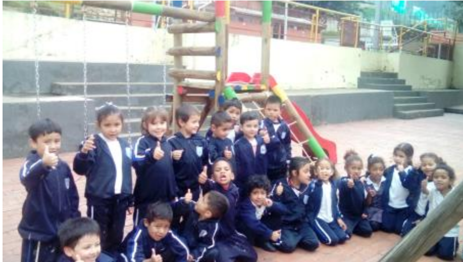
Figura 7. Campaña “Cuidado y ahorro de Agua y la entrega de un parque Infantil al Colegio Agustín Fernández.