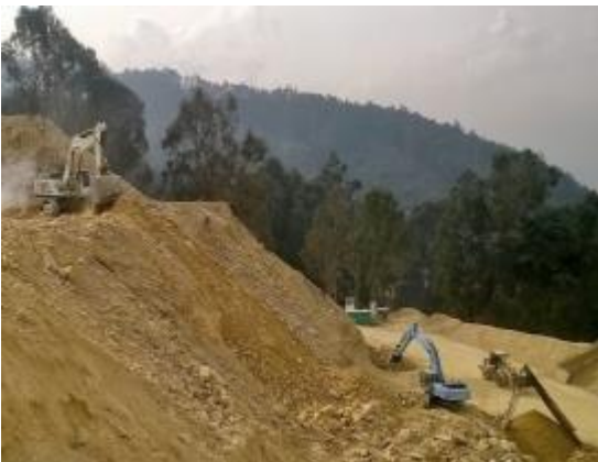
Construcción de Terrazas