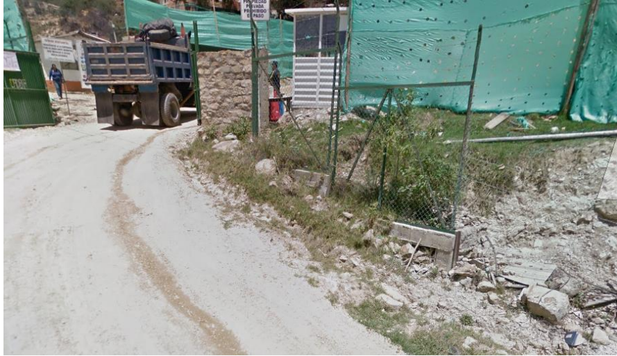
Puerta de Ingreso y Salida de la Cantera "El Cedro"

Las comunidades y/o poblaciones asentadas en las zonas más próximas a estas áreas de trabajo son: