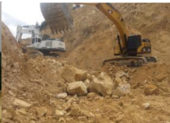
Remoción de Bloques