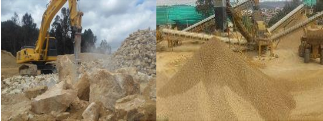
Reducción de Bloques por Impacto