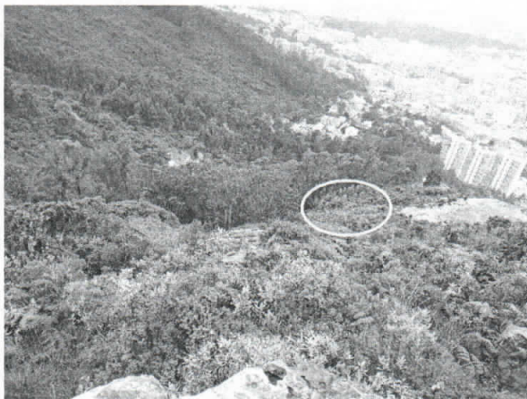
Parcela con cabuya