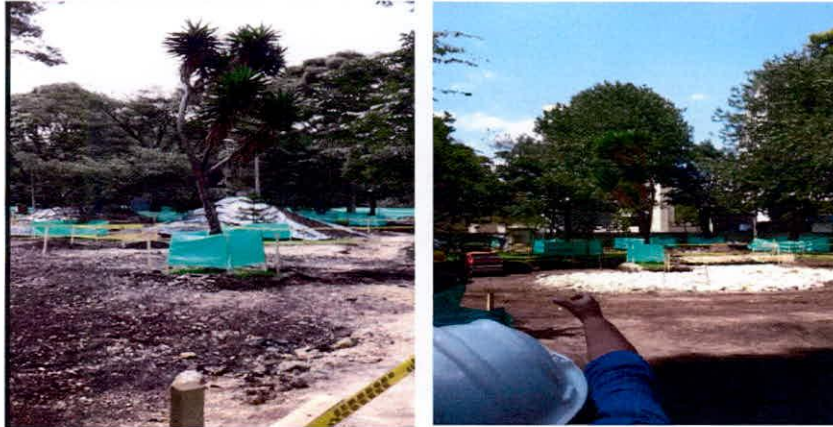
Registro fotográfico de enviado por la comunidad