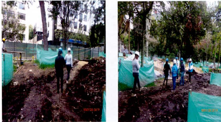
Registro fotográfico de visita de Secretaria Distrital de Ambiente y Jardín Botánico e IDRD Martes 28 de mayo de 2019.

Como se puede verificar en las conclusiones de las actas y los informes de las Entidades de control, evidencian la totalidad del arbolado sin intervenciones silvicultural lo que quiere decir que la medida cautelar interpuesta por la Juez no ha sido violada por las actividades de obra que actualmente se están desarrollando.