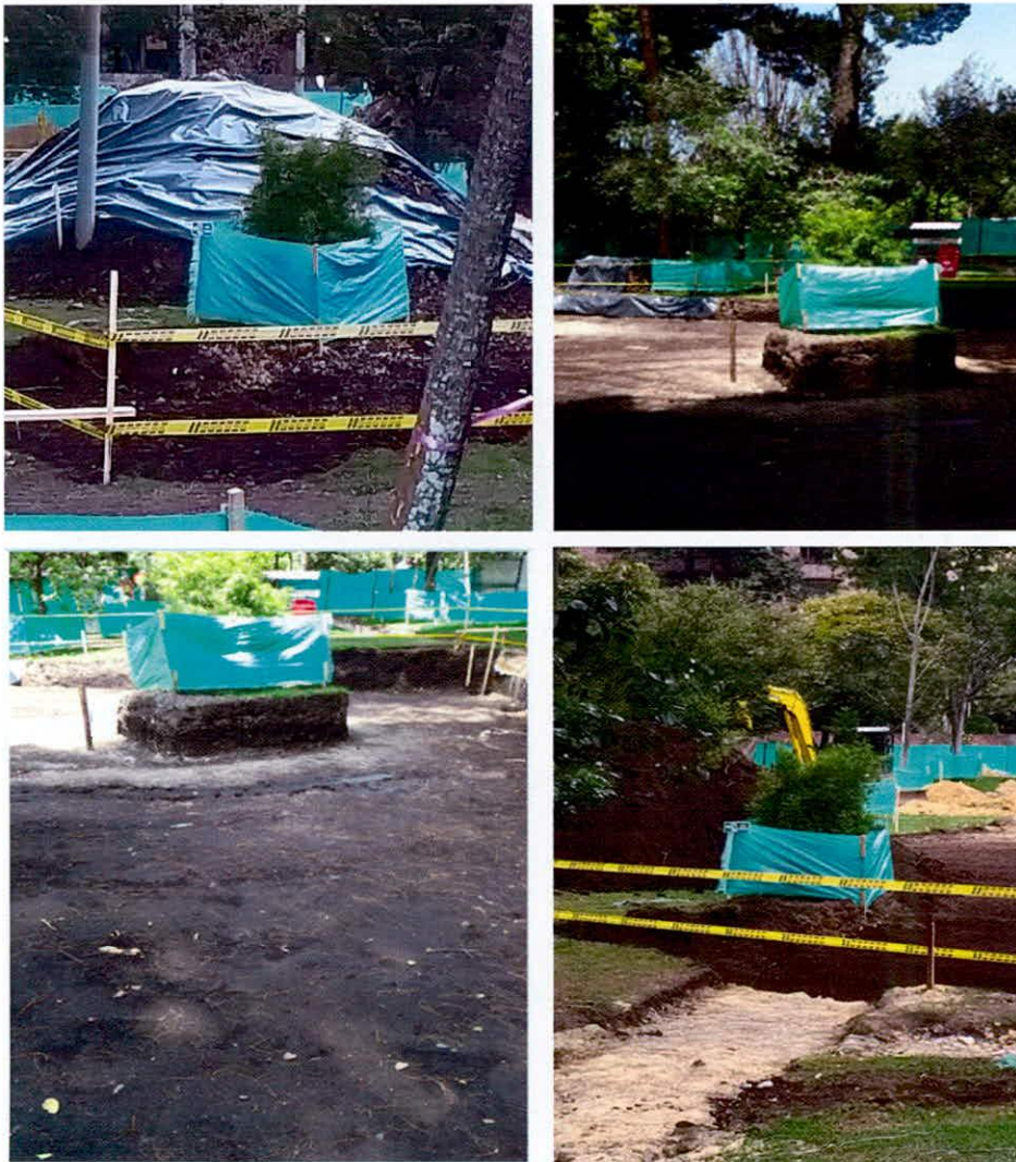
Registro fotográfico de enviado por la comunidad