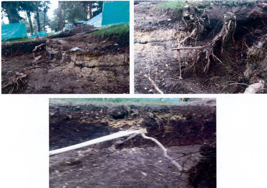
Registro fotográfico de enviado por la comunidad