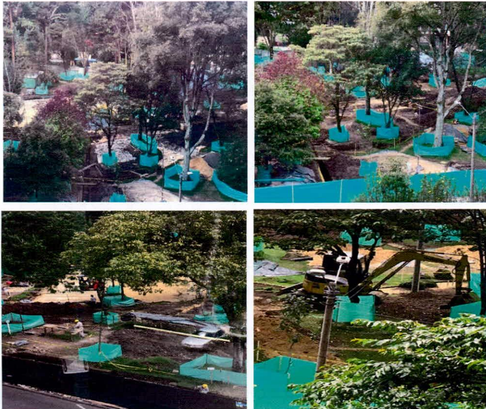
Registro fotográfico de enviado por la comunidad