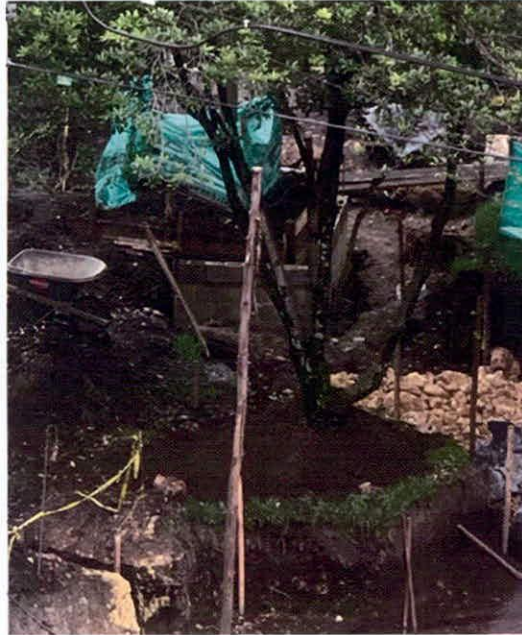
Registro fotográfico de enviado por la comunidad