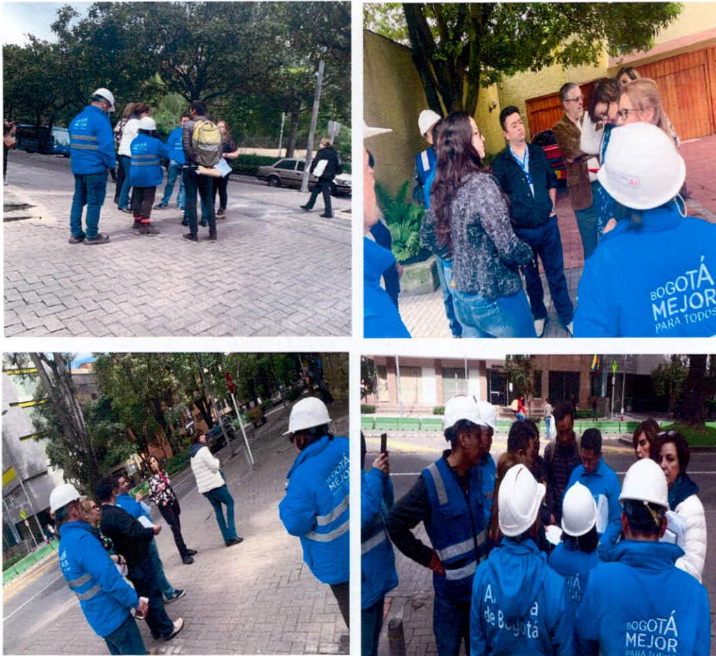
Registro fotográfico de visita de Secretaria Distrital de Movilidad viernes 7 de junio de 2019

Con el fin de considerar nuevas estrategias relacionadas con la señalización, se realizó visita conjunta entre el IDR D y la Secretaria de Movilidad el viernes 7 de Junio de 2019, de la cual se adjunta en medio digital, carpeta denominada compromiso 2.