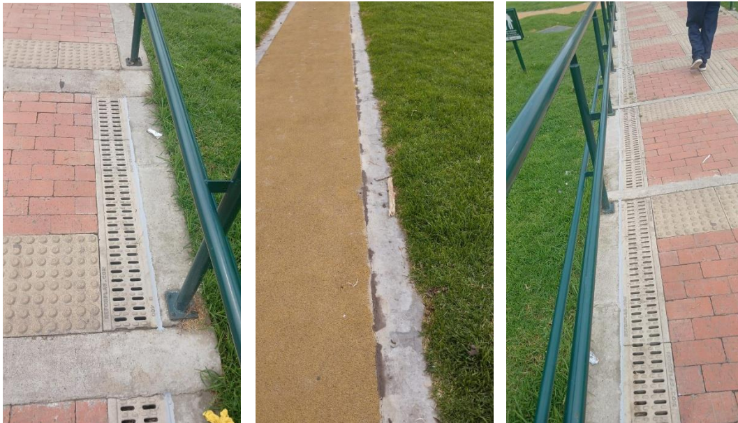
Ilustración 8. Dilataciones entre cauchos bordillos y cárcamos.