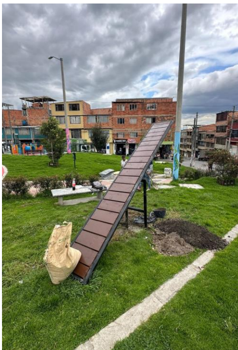
Ilustración 1. Arreglo de balancín o sube y baja del gimnasio canino.