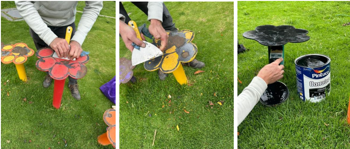
Ilustración 2. Arreglo postes de equilibrio para mascotas.