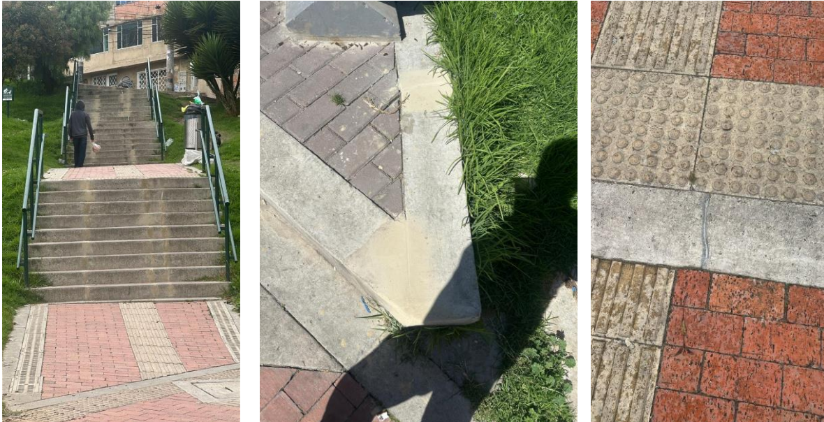
Ilustración 6. Reparación juntas cintas.