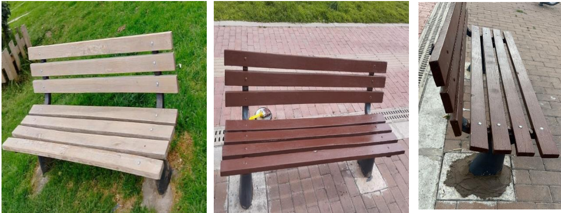
Ilustración 5. Proceso de bancas y sillas.