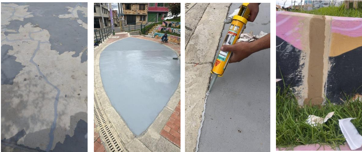
Ilustración 10. intervención teatrino