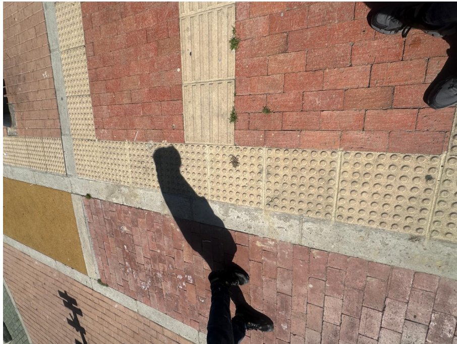
Ilustración 7. Emboquillado de juntas elementos prefabricados