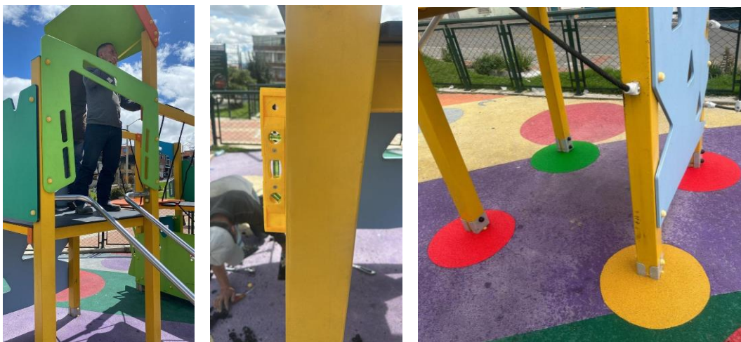
Ilustración 4. Ajuste de parque infantil.