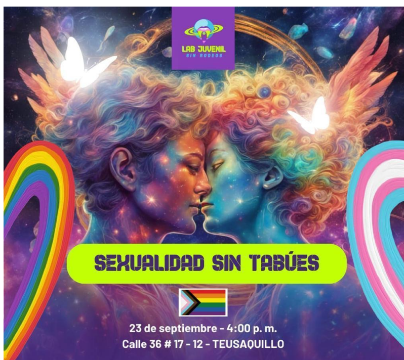
Ilustración 1. Pieza publicitaria Taller Sexualidad Sin Tabúes

Fuente: Elaboración propia con aprobación por parte de la Oficina de prensa de la Alcaldía local de Teusaquillo y la encargada de comunicaciones de ACDI VOCA