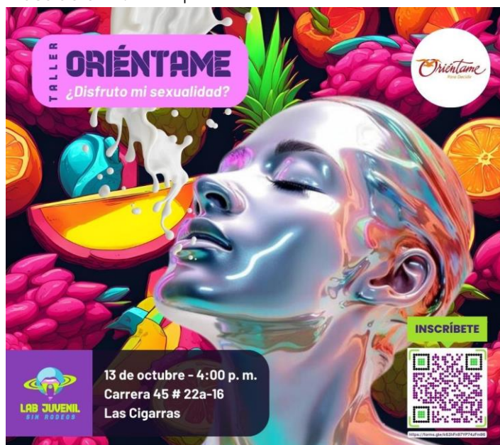
Ilustración 2. Pieza publicitaria Disfrute de mi sexualidad