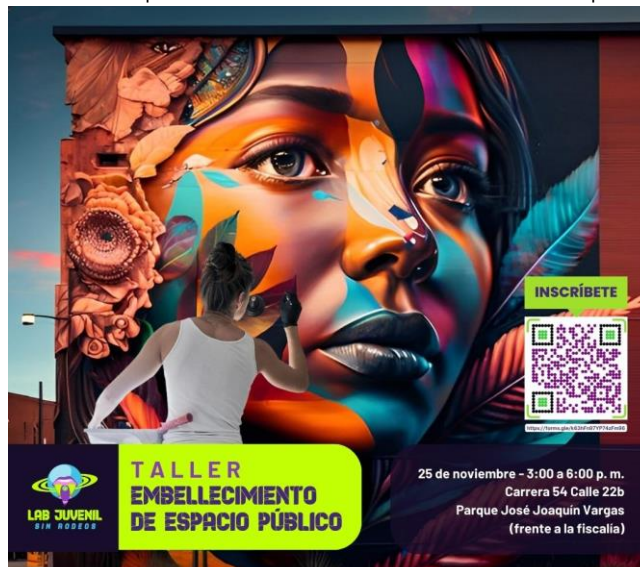
Ilustración 7. Pieza publicitaria Embellecimiento en el espacio público