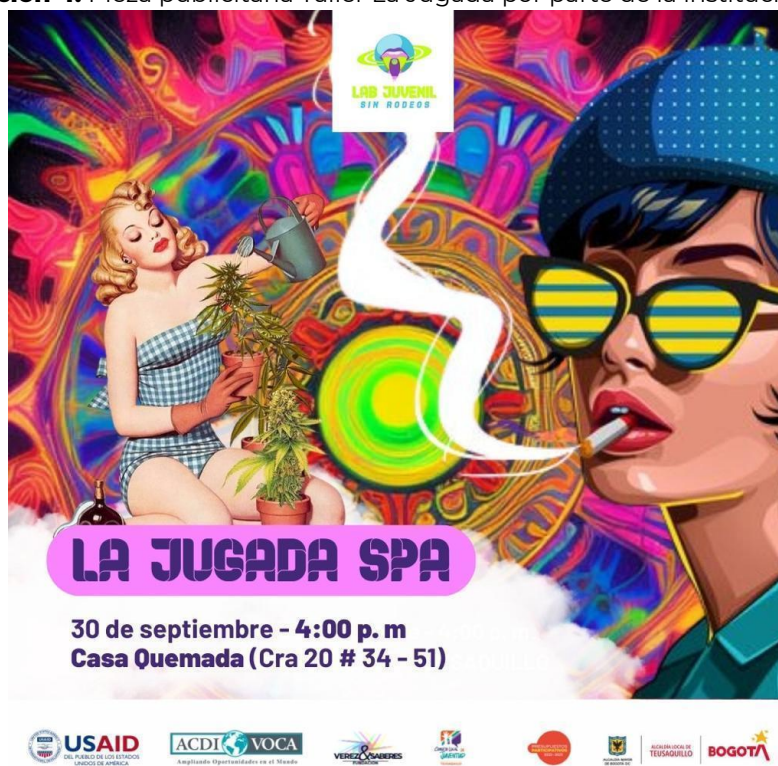
Ilustración 4. Pieza publicitaria Taller La Jugada por parte de la institucionalidad