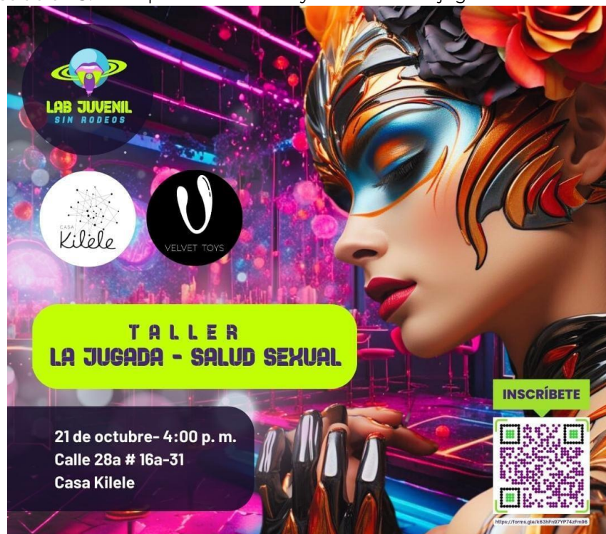
Ilustración 3. Pieza publicitaria Mitos y realidades “La jugada en Salud Sexual”