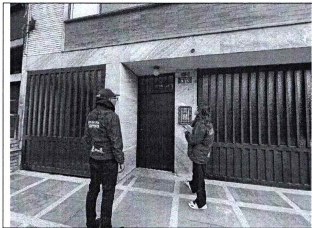
Fotografía 3. Visita ciudadano

Como se observa en el registro fotográfico 1 y 2, se identificaron residuos vegetales y no aprovechables arrojados en el espacio público fuera de los horarios y frecuencias de recolección de residuos y en sitios no autorizados. No obstante, no es posible identificar el origen de estos. Se realizó visita a ciudadano ubicado en la Calle 63 no. 3-25 apartamento 101, el pasado viernes 09-06-2023, sin embargo, no fue posible encontrar al ciudadano. Por lo que, se solicitará a la Unidad Administrativa Especial de Servicios Públicos la limpieza y recolección de estos residuos y al operador de aseo Promoambiental Distrito el abordaje de los ciudadanos a través de sensibilización sobre los horarios de recolección y los sitios autorizados para presentar los residuos.