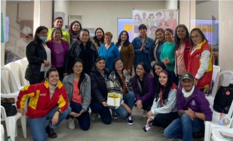
Encuentro Local de Instancias de La Candelaria. 10 agosto 2023

como las autónomas tienen como punto de partida y motivación buscar estrategias que permitan mitigar las problemáticas de los grupos poblacionales a quienes representan. De esta manera, no es solamente el seguimiento a una política pública o el cumplimiento a un acto administrativo lo que fundamenta el quehacer de estos espacios, sino que parte de una acción de base ciudadana que potencializa el tejido social a nivel local y distrital.