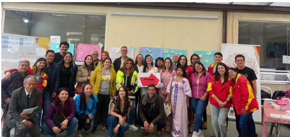
Encuentro Local de Instancias de Teusaquillo. 25 julio 2023