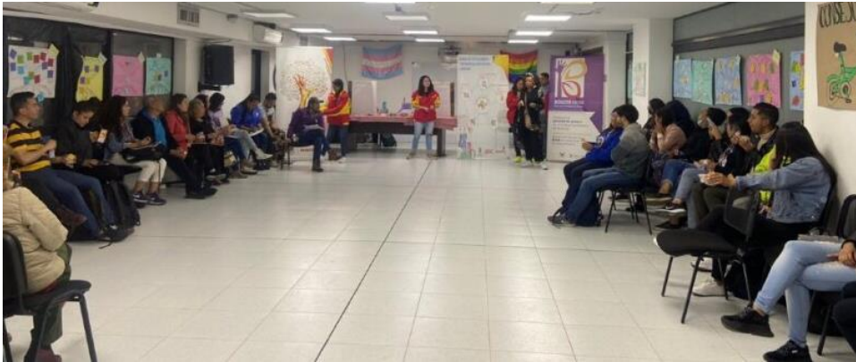
Encuentro Local de Instancias. 29 junio 2023

De los retos más recurrentes en los diferentes encuentros se identificaron: la baja participación, el no cumplimiento de propósitos, la falta de articulación normativa, las fallas en el proceso de conformación de las instancias y la dispersión de estos espacios. Esto hace que, para el Instituto Distrital de Participación y Acción Comunal – IDPAC, sea relevante identificar qué estrategias se pueden desarrollar para solucionar estos retos de la mano con las propuestas ciudadanas como, por ejemplo, la conformación de redes de instancias que permita el reconocimiento de los actores territoriales que están en estos espacios, para fortalecer las alianzas en los diferentes procesos locales.