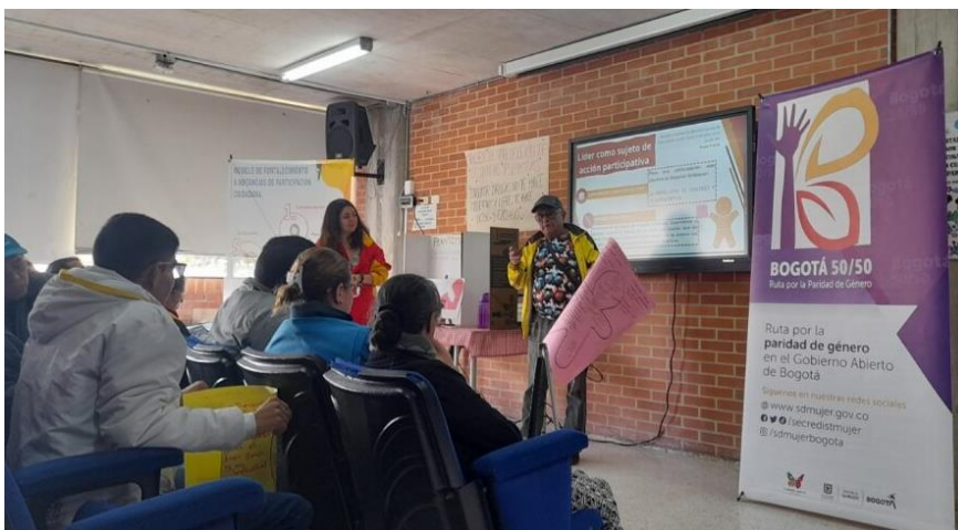
Encuentro Local de Instancias de Santa Fe. 23 junio 2023