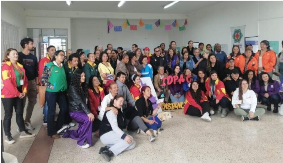
Encuentro Local de Instancias de Fontibón. 18 mayo 2023

necesario llegar a mayor cantidad de espacios de participación para potencializar aún más las reflexiones alrededor de la participación ciudadana. Igualmente, se identificó que existe una barrera en cuanto renovación de liderazgos, lo que puede profundizar el desgaste de las personas activas en las instancias locales y distritales. Así, identificar estos problemas, ayuda a desarrollar un mapeo general de las necesidades en la participación y, con ello, brindar las herramientas y estrategias necesarias que motiven a la ciudadanía de ser parte de los procesos participativos; eso implica, potencializar las capacidades técnicas del equipo territorial para la respuesta a las necesidades de las localidades.