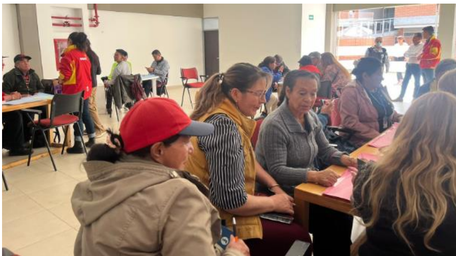
Encuentro Local de Instancias de Bosa. 25 agosto 2023