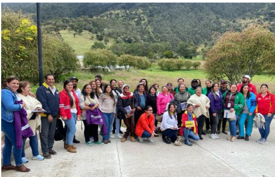
Encuentro Local de Instancias de Sumapaz. 11 septiembre 2023