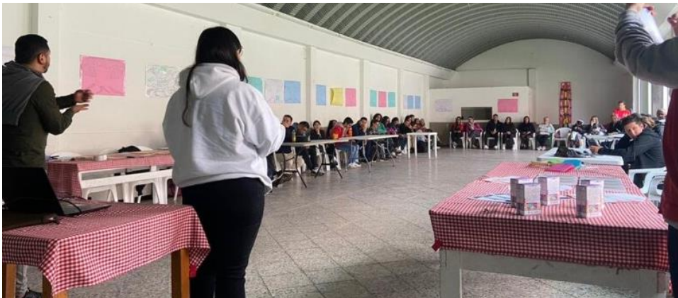
Encuentro Local de Instancias. 22 julio 2023