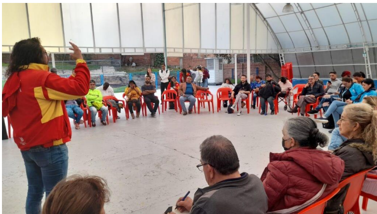
Encuentro Local de Kennedy. 28 abril 2023.

Los encuentros locales de instancias han potencializado el reconocimiento de los múltiples actores de la localidad que han generado tanto procesos participativos territoriales, como iniciativas de base comunitaria que permiten el fortalecimiento del tejido social. Este reconocimiento de los múltiples actores permite fortalecer procesos de identificación y de alianzas, lo que proporciona herramientas para aumentar la incidencia en estas acciones locales.