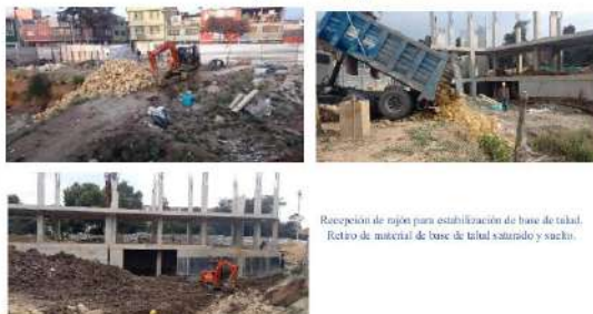
Recepción de rajor para estabilización de base de talud. Retiro de material de base de talud saturado y saclo.