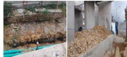
Limpieza de recebo y material suelo del área de arden peatonal para inspección de tuberías Enef y ETB contra calle 36.