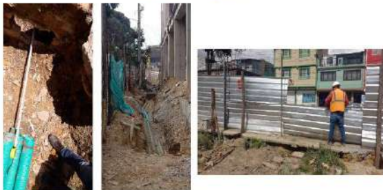
Limpieza de área de arden peatonal contra calle 36 Sur para inspección de tuberías Enef y ETB para completar conexión. Reafirmación de puerta provisional para entrada de material y equipos calle 35B Sur