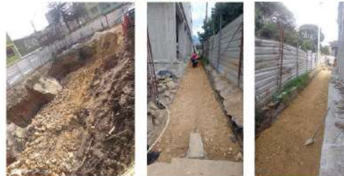
Excavación de trincheros y tendido de rajor para estabilización de base del talud. Conformación de capas de recebo en área de arden contra calle 36 Sur