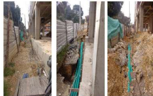
Limpieza de área de arden peatonal para inspección de tuberías Enef y ETB