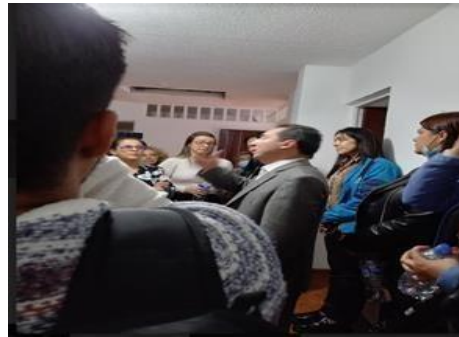
Predio N° 2, ubicado en la Carrera 26 C N° 35 C - 20 sur.