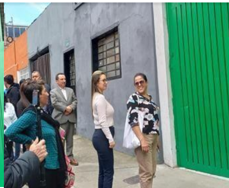
Predio N° 3, ubicado en la calle 32 A sur N° 26 - 43