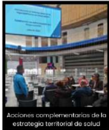
Acciones complementarias de la estrategia territorial de salud

Proyecto 2188 - Santa Fe con un sistema de cuidado