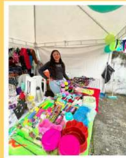
Microempresa Local 3.0