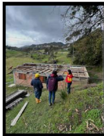
Mejoramiento Vivienda Rural