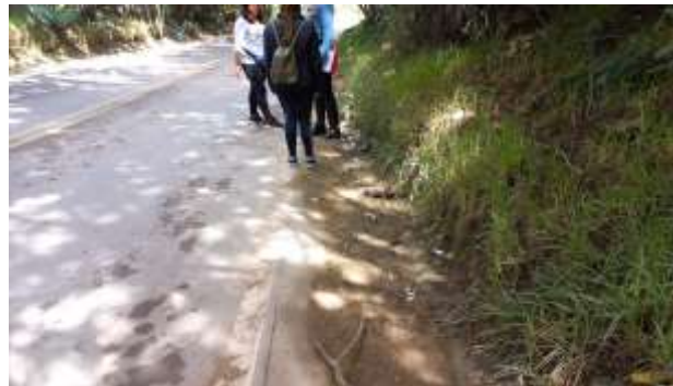
Figura 1. Estado de cunetas

A continuación, se ilustra registro fotográfico del estado de las cunetas y del estado de reserva de los segmentos viales en cuestión: