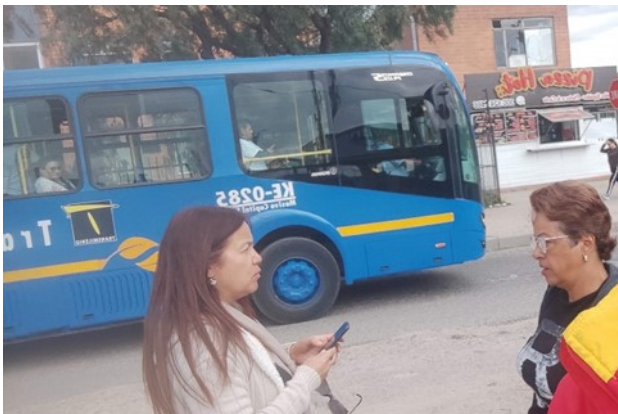
Foto uno recorrido 9 de mayo, Carrera 95A con calle 73