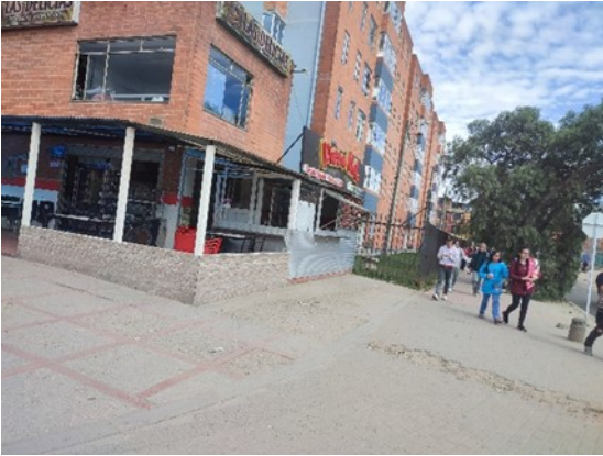
Foto tres recorrido 9 de mayo, Carrera 95A con calle 73

10 de mayo 2023: Se emite oficio con radicado No 20235720739151 de la Alcaldía Local de Bosa, a la secretaria de movilidad, en el cual se solicita la instalación de semaforización de acuerdo con las necesidades identificadas en el recorrido realizado el 9 de mayo.