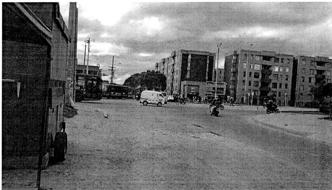
Foto recorrido 9 de mayo, Carrera 95A con calle 73.