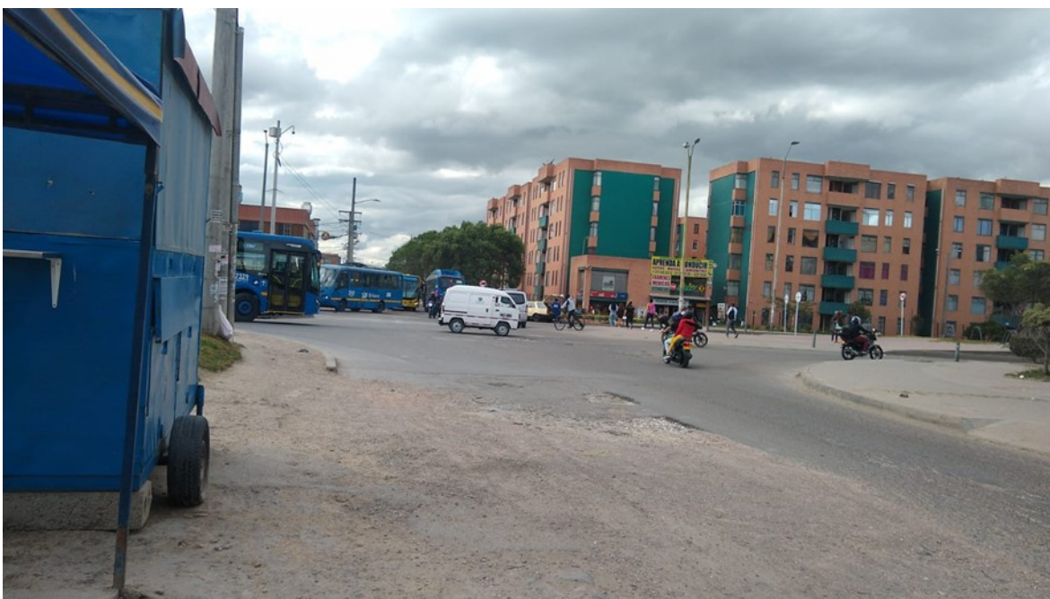
Foto dos recorridos 9 de mayo, Carrera 95A con calle 73