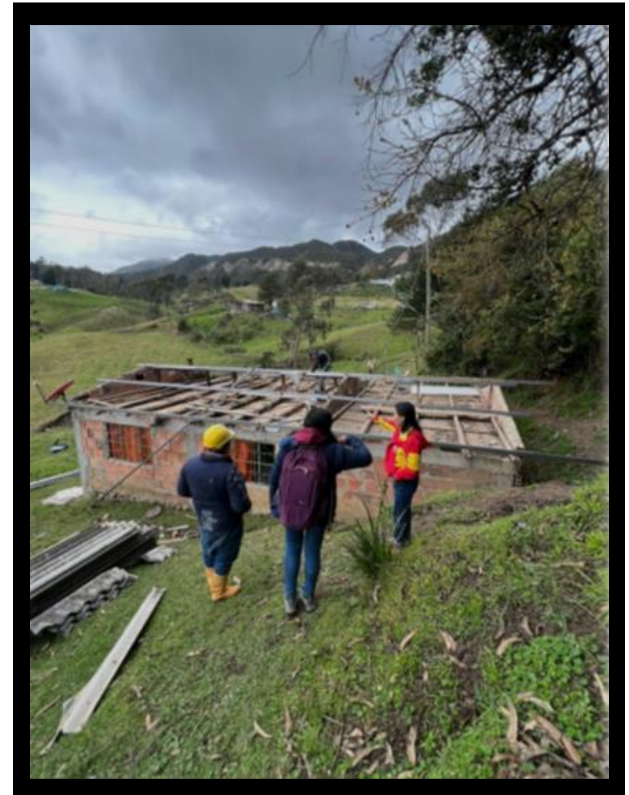
Mejoramiento Vivienda Rural