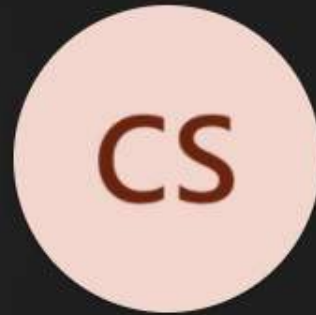
Converger Social. (Invitado)