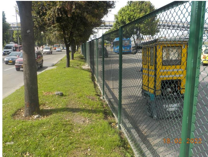
Fotografía 1: Implementación 236.5m de mallas peatonales