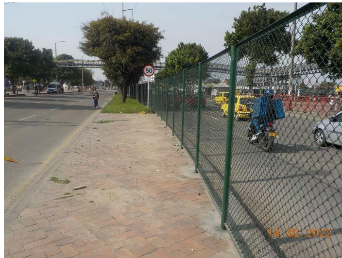
Fotografía 2: Implementación 236.5m de mallas peatonales