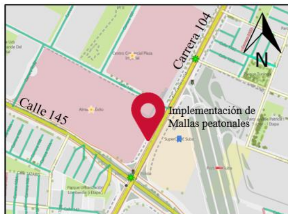
Imagen 1: Ubicación de implementación de mallas peatonales

En relación a lo indicado en el oficio de la referencia, en el cual se solicita “colocar mallas peatonales frente al Centro Comercial plaza Imperial” se informa, luego de verificar la base de datos de sistemas de contención de la entidad que: en el lugar del requerimiento la Carrera 104 entre Av. Suba (Calle 145) y la calle 148 (Acceso buses al portal Sur de Transmilenio) se realizó implementación de 236.5m de mallas peatonales mediante el contrato de obra No2019-1870 cuyo objeto es “SUMINISTRO E INSTALACIÓN DE SISTEMAS DE CONTENCIÓN VEHICULAR, ELEMENTOS DE CANALIZACIÓN PEATONAL Y OTROS DISPOSITIVOS DEL CONTROL DEL TRÁNSITO EN DIFERENTES CORREDORES VIALES DE LA CIUDAD DE BOGOTÁ D. C”, se muestra a continuación la ubicación de las mismas: