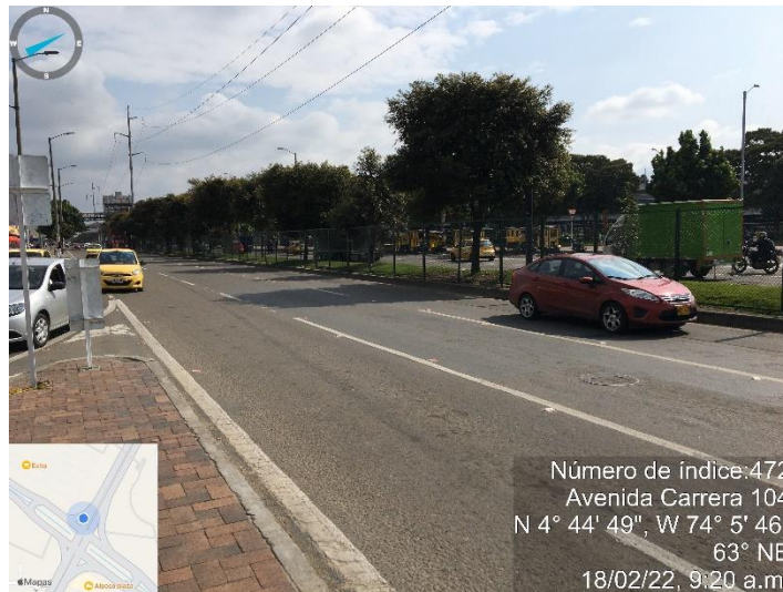
Fotografía 3: Implementación 236.5m de mallas peatonales