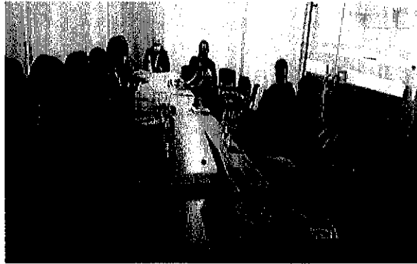
Imagen 1. Registro fotográfico de la sesión

Al final de la sesión quedo como compromiso realizar mesa de trabajo con el IDPAC para orientarlos en la implementación del proceso sancionatorio y en el uso de la herramienta del SIPEJ.