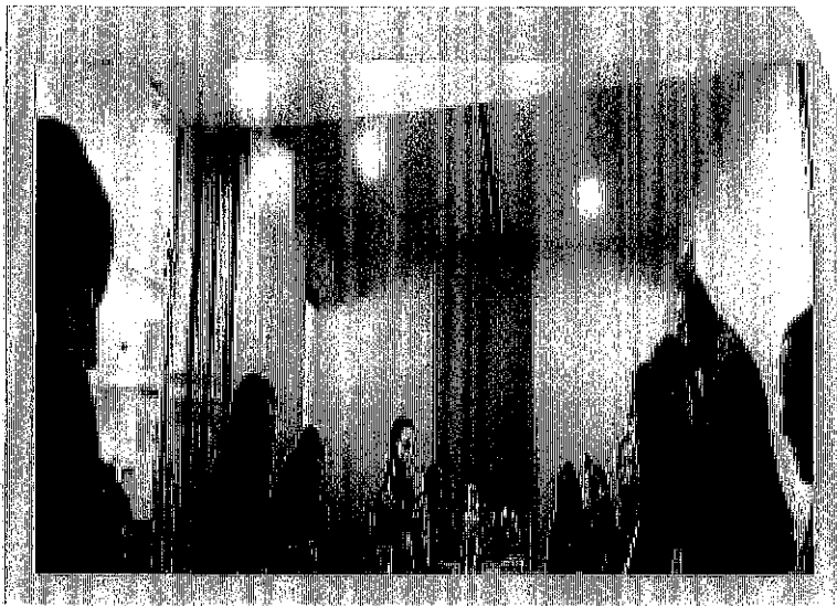
Imagen 4. Registro fotográfico de la sesión.

Se adjunta presentación en power point que contiene el resumen de cada una de las mesas de trabajo aquí relacionadas.