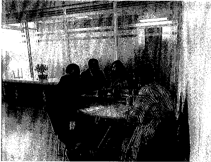
Imagen 3. Registro fotográfico de la sesión.