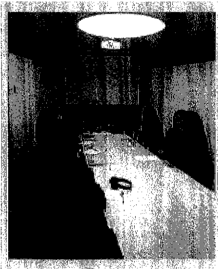
Imagen 2. Registro fotográfico de la sesión

Los temas tratados fueron: (i) Proceso de emisión de certificados de la Dirección IVC – SJD, (ii) Lineamientos jurídicos, financieros y contables para la expedición de los certificados de registro y (iii) Aspectos de seguridad y control.