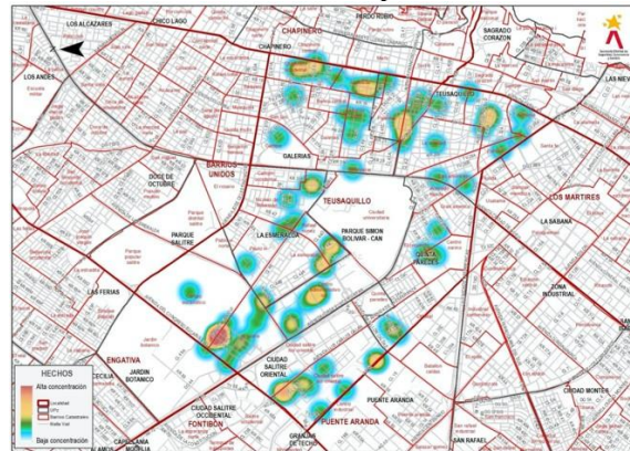
Gráfico 2. Concentración de hechos de violencias sexuales por UPZ-Localidad Teusaquillo, 2020.