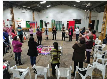
Articulación SDMujer, Alcaldía Local y lideresas del COLMyEG : Encuentro interlocal de lideresas de los COLMyEG de Bosa, Rafael Uribe, Ciudad Bolívar y Tunjuelito