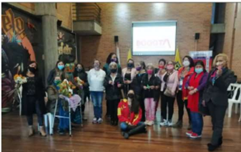
Articulación Consejera consultiva y Alcaldía Local: Encuentro semi presencial CCM –EA