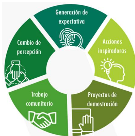
Imagen 1. Aspectos relevantes del 'urbanismo táctico'.

nuevas lógicas sociales y/o resolver inconvenientes tales como la invasión del espacio, inseguridad, mal estado o deterioro del espacio y baja afluencia de ciudadanos, siempre en compañía de la comunidad y enfocado particularmente a sitios y comunidades especialmente golpeadas por la pandemia.