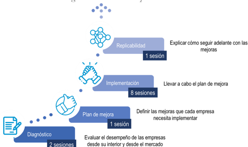
Ilustración 5: Fases del Programa de Hábitos Empresariales

El detalle de cada etapa se presenta en la Guía Operativa correspondiente.