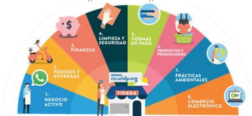
Ilustración 3. Guías metodológicas En Marcha Digital

Esta metodología aborda 8 guías y consejos prácticos, las cuales se resumen en la siguiente ilustración.