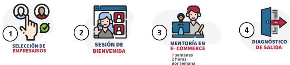
Ilustración 6: Etapas de Comercio Electrónico

La participación en el Componente 4 corresponde a un incentivo para aquellos empresarios que demuestren un desempeño superior y que cuenten con unos requisitos habilitantes idóneos para el desarrollo de actividades de comercio electrónico. Esta actividad contempla una sesión de bienvenida, 7 semanas de mentorías especializadas en comercio electrónico y diagnóstico de entrada y de salida, tal y como se evidencia a continuación.