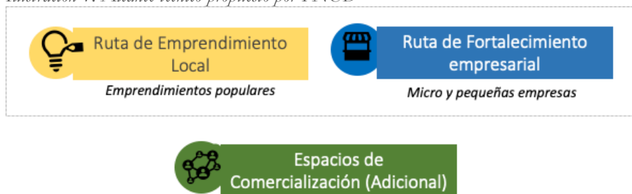
Ilustración 1: Alcance técnico propuesto por PNUD

Para cumplir con las expectativas de las Alcaldías Locales, contribuir a la Reactivación Económica y lograr el impacto esperado en las unidades productivas, se ha propuesto el desarrollo de 2 Rutas de acompañamiento y el desarrollo de Ferias comerciales (como servicio adicional), así como se evidencia la siguiente ilustración.