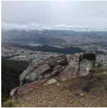
Fig (1). Atractivo Mirador