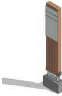
Fig (4). Señalética Interpretación