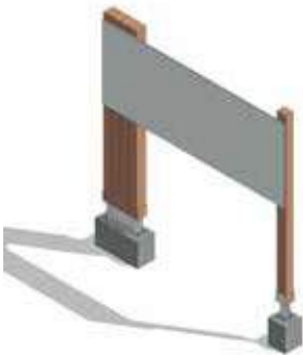
Fig (5). Señalética Información