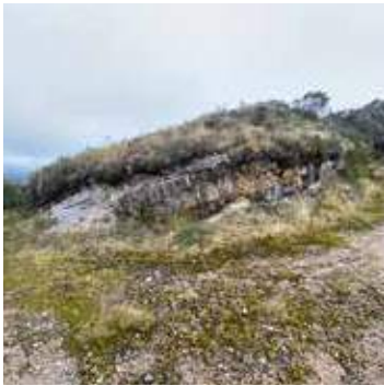
Fig (3). Atractivo Estación