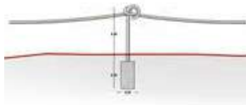
Fig (5). Mobiliario Baranda