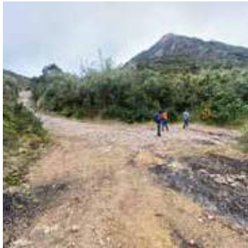
Fig (2). Atractivo Valor paisajístico