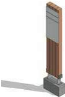
Fig (6). Señalética Interpretación