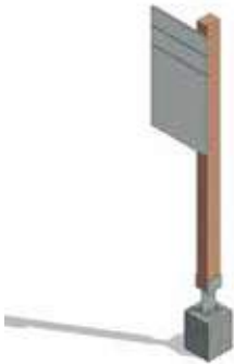
Fig (2). Señalética Orientación